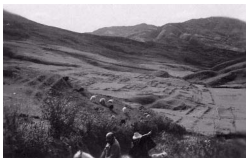
FIGURE 6-4. Foto del acclahuasi de Caxas.

En la margen izquierda del río Rey Inca se localizan el portazgo, el acclahuasi (cuyo plano fue dibujado por Bonpland y se puede contrastar en la foto que ilustra el Gráfico N° 4), kallankas, conjuntos de depósitos y kanchas residenciales; en la otra margen se encuentra el templo del sol, la plaza, el ushnu y también kanchas. Las edificaciones anteriores caracterizan a una capital provincial. El Camino Inca pasa a un costado del portazgo y frente al acclahuasi.