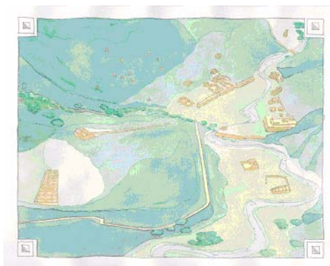
FIGURE 6-3. Reconstrucción hipotética de Caxas. Dibujo: C. Campos 2003.

En la margen izquierda del río Rey Inca se localizan el portazgo, el acclahuasi (cuyo plano fue dibujado por Bonpland y se puede contrastar en la foto que ilustra el Gráfico N° 4), kallankas, conjuntos de depósitos y kanchas residenciales; en la otra margen se encuentra el templo del sol, la plaza, el ushnu y también kanchas. Las edificaciones anteriores caracterizan a una capital provincial. El Camino Inca pasa a un costado del portazgo y frente al acclahuasi.