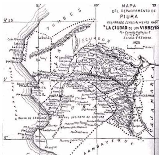
FIGURE 6-1. Mapa de Piura.

Al este de Aypate está situada sobre la Cordillera una planicie llamada la plaza del Inga, con ruinas de un palacio y de todo un pueblo Peruano... Este palacio al este de Aypate está ciertamente situado en el camino que va del Azuay a Cajamarca y quizás al Cuzco. (op. cit. p. 18).